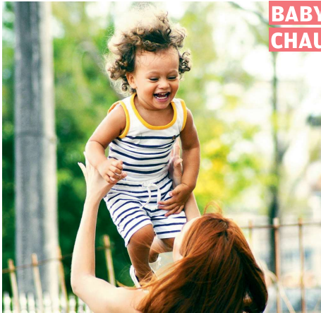
UN ALGORITHME DE MATCHING ET C'EST PARTI